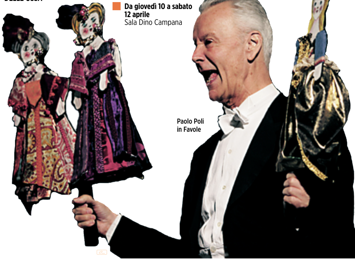
Paolo Poli in Favole

Mercoledì 28 e giovedì 29 maggio FAVOLE di e con Paolo Poli musiche suonate al pianoforte da Antonio Ballista burattini di Bruno Cereseto da bozzetti di Emanuele Luzzati Premio Olimpico 2007 come MIGLIORE ATTORE