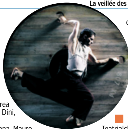
La veillée des abysses

Da martedì 15 a sabato 19 gennaio Teatro della Tosse WOYZECK di Georg Büchner, regia di Claudio Morganti con Claudio Morganti e i sei attori giovani della Compagnia della Tosse, scene a cura degli allievi dell'Accademia Ligustica di Belle Arti PRIMA NAZIONALE