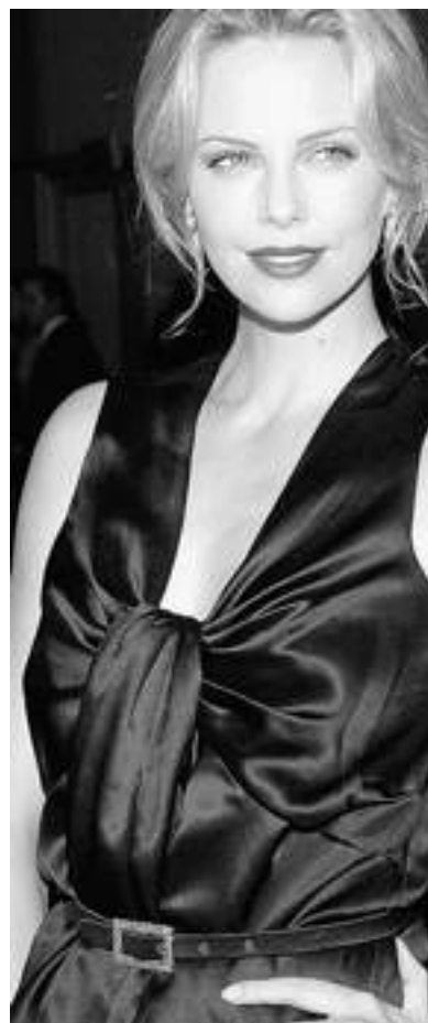
Theron, la più sexy. Secondo la rivista Esquire Charlize Theron, 32 anni, è la donna più sexy del mondo davanti all'americana Jessica Biel